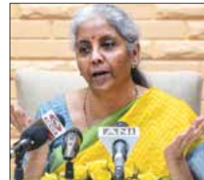
Finance Min Nirmala Sitharaman

NEW DELHI: Finance Minister Nirmala Sitharaman on Monday said discussions with regard to central bank-backed digital currency have been going on with the Reserve Bank and a decision will be taken after due deliberations.