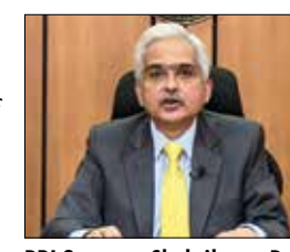
RBI Governor Shaktikanta Das

today, he said. He was responding to questions after the meeting of the RBI's Central Board of Directors. The meeting was addressed by Finance Minister Nirmala Sitharaman. "Our inflation projections... I would say it is quite robust and we stand by it. If there is something of course totally unforeseen and you know, which nobody can expect that is different and we have said that it is contingent on you know the risk the downside or the upside risk to these projections is the crude prices," the Governor added. He further said price stability, which basically means maintaining and adhering to the inflation target, is def-